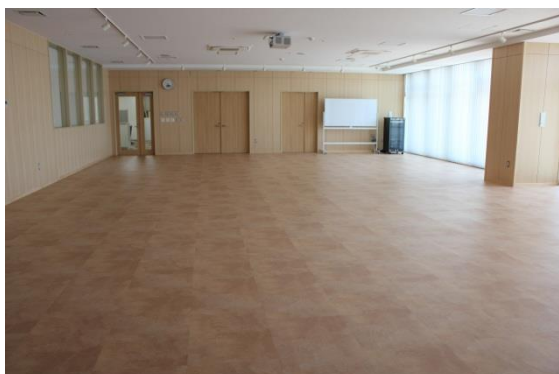
1階コミュニティホール (スクール仕様の場合90名)