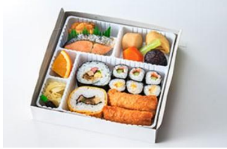
寿司弁当【すずらん】