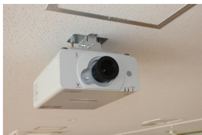
¥4,070/回 プロジェクター