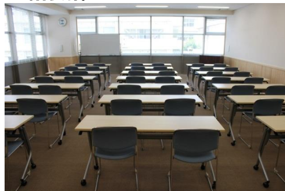
2階会議室B スクール仕様42名