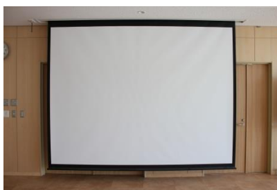
¥2,030/回 スクリーン(80インチ)