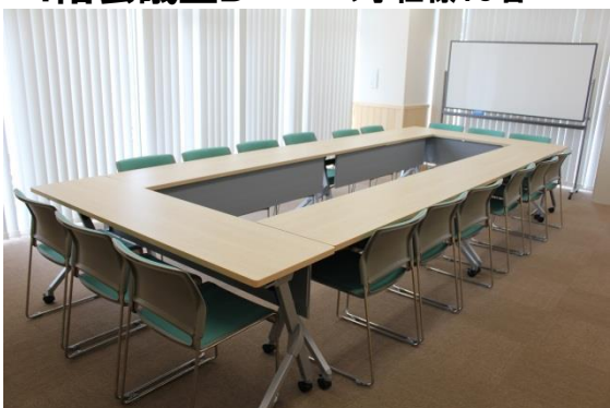
4階会議室D 口の字仕様18名