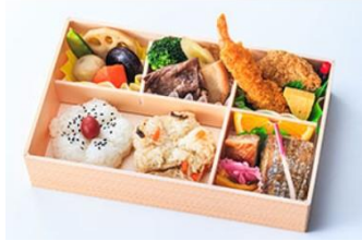
特選幕の内【矢車草】