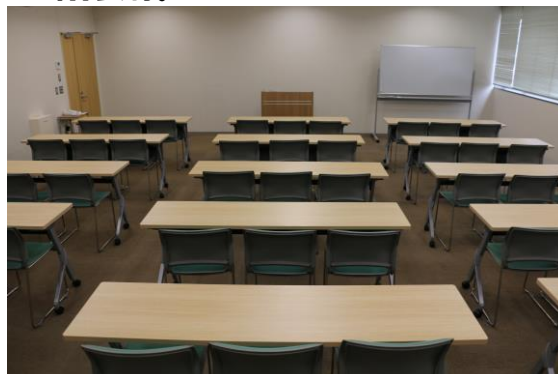
4階会議室F スクール仕様45名