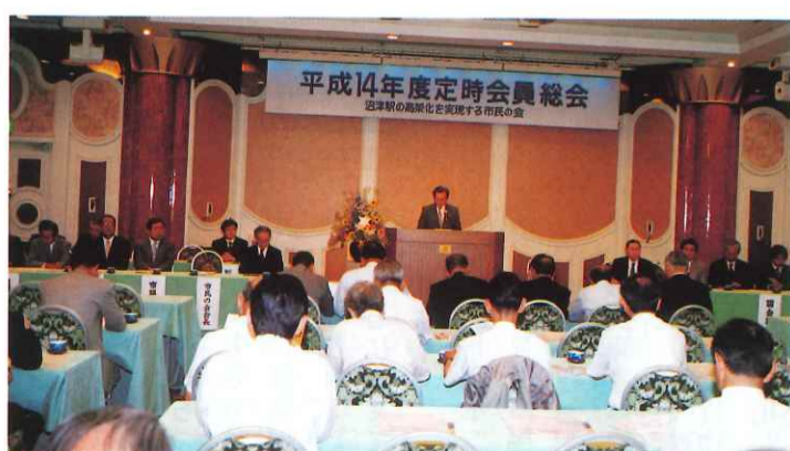
●平成14年度定時会員総会を開催

沼津駅周辺総合整備事業の事業費縮減について、沼津市の今後の財政見通しについて 第3回 平成15年2月14日(金) 沼津駅周辺総合整備事業の取り組み状況について、その他