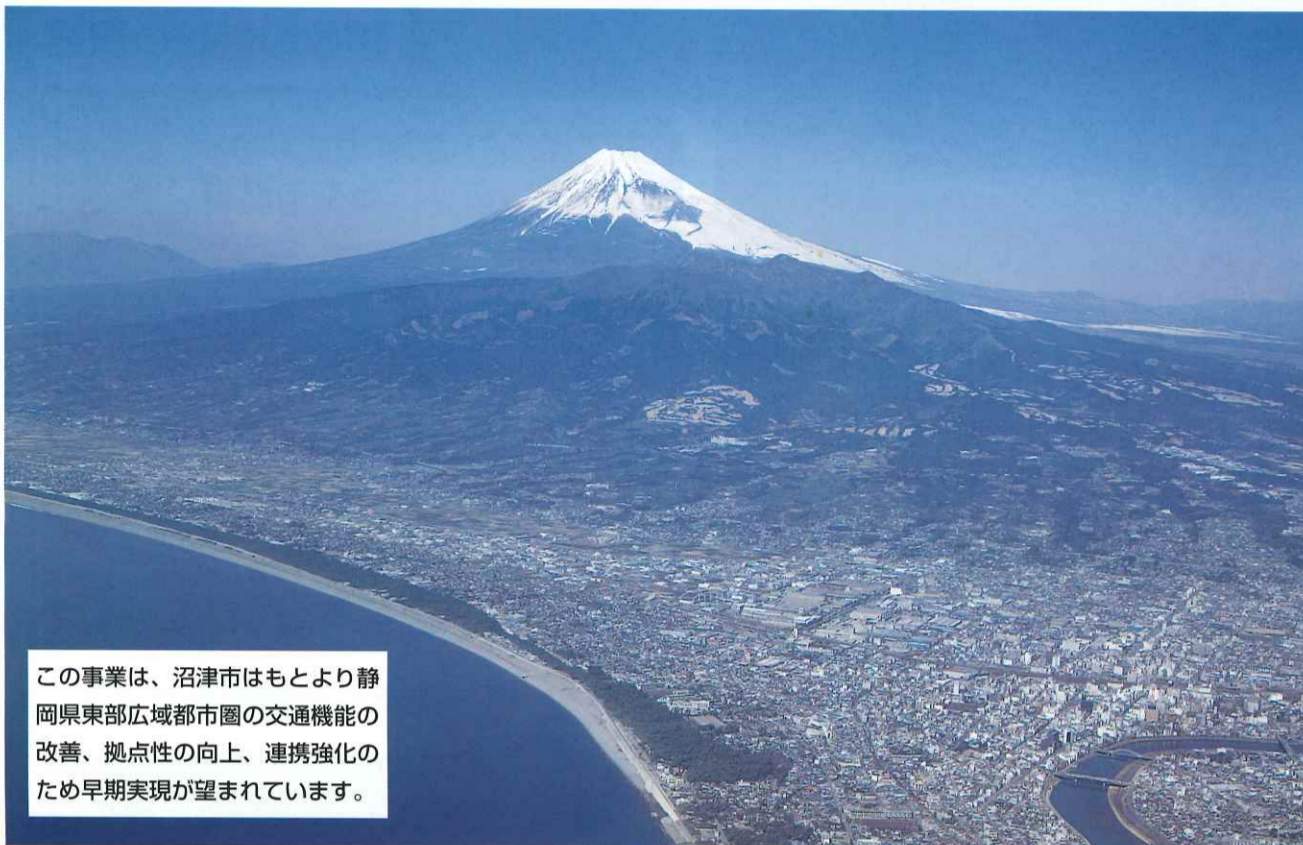
この事業は、沼津市はもとより静岡県東部広域都市圏の交通機能の改善、拠点性の向上、連携強化のため早期実現が望まれています。

編集・発行／沼津駅の高架化を実現する市民の会 〒410-0832沼津市御幸町14-5(沼津商工会議所内) TEL<055>931-1111(代)・FAX<055>931-1115