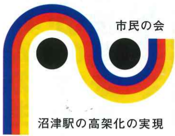
沼津駅の高架化の実現