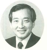
沼津市長 桜田光雄