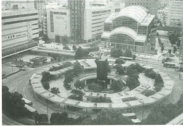
鉄道高架化事業に併せ完成した浜松駅前広場・周辺施設