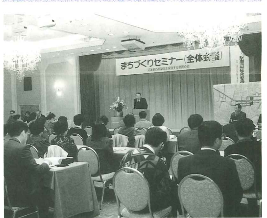
レポーターの先進地現場報告も…… 於ブケ東海