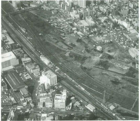
鉄道高架化に向けて大きく踏み出した沼津駅とその周辺