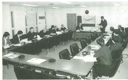
正副会長会議 94.2.10 於商工会議所