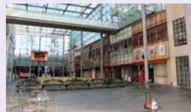
賑わいの核となる、全天候型の多目的広場“グランドプラザ”を整備