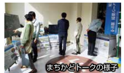
まちかどトークの様子

まちかどトークでは、鉄道高架事業に関する資料や模型の展示、動画の上映などにより、市民に鉄道高架事業の内容が伝えられるとともに、直接市民の声に耳を傾ける取り組みが行われています。