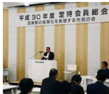
平成30年度総会の様子

とき 平成30年10月15日(月) 場所 プラサヴェルテ (2) 正副会長・事務局合同会議 とき 平成30年6月11日(月) 場所 沼津市大手町フーディアム 議題 定時会員総会に諮る議案について