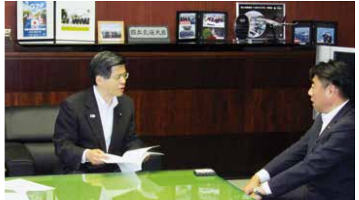
要望書に目を通す石井大臣