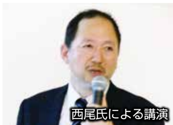
西尾氏による講演