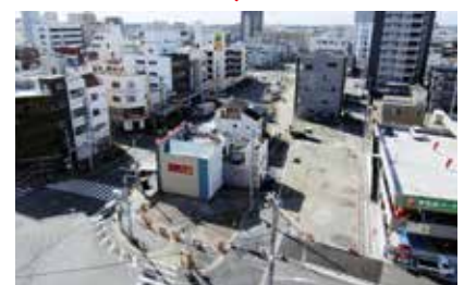
市内あまねガード南付近