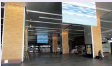
ほっとできる空間を演出するため、富山県産杉が用いられた富山駅構内