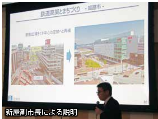
新屋副市長による説明

沼津市でのまちづくりにおいても、 鉄道高架のインパクト を活かした、ヒト中心の公共空間の再編や、新たな都市機能の導入が求められる。