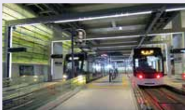
高架下にある路面電車の停留所。壁面は大自然がイメージされている