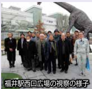
福井駅西口広場の視察の様子

福井市では、北陸新幹線の開通が予定されていますが、福井駅周辺で、鉄道施設により東西市街地が分断されてしまい、十分な都市機能が発揮されていないという問題がありました。