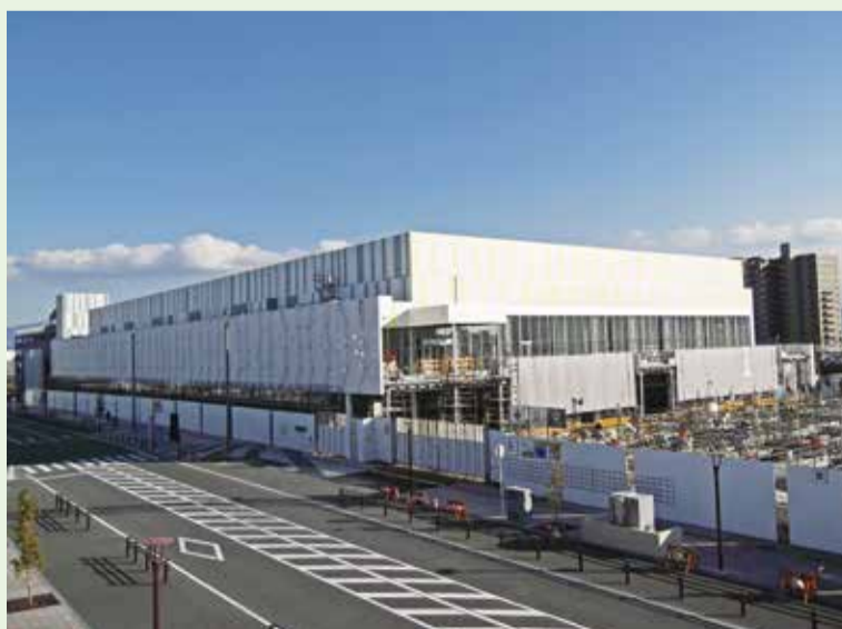
開館に向けて準備が進む展示イベント施設「キラメッセぬまづ」 ※一般のご利用は7月18日からです。