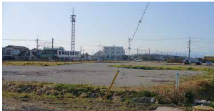
南北交通路の整備や地域のためのインフラの整備が行われます。

片浜地区の明電舎西側に広がる広大な土地が新車両基地の建設用地です。この基地は、車両の点検・留置・洗浄などをする施設です。周辺には、調整池・緑地を設けるなど環境に配慮するとともに、鉄道を立体交差し、旧国道1号と国道1号を結ぶ道路や、片浜地区と沼津駅を直接結ぶ道路等を整備することで、生活環境の向上や交通の利便性が高まります。平成20年度には、埋蔵文化財調査が行われる予定です。