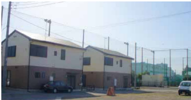
ここに住みながらまちづくりに協力していただいています。