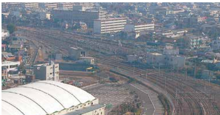
鉄道高架事業で沼津の中心部に広い用地が生まれます。