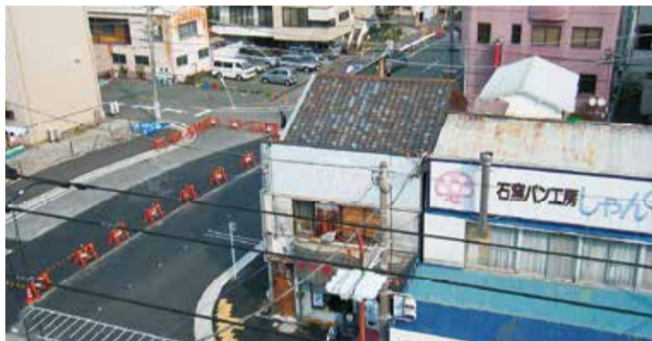
鉄道高架化後は新たな南北道路もできます。

平成17年7月から工事に着手した再開発ビル「イーラde」がいよいよ3月20日オープンとなりました。このビルは高さ約78m、地下1階、地上20階で地下1階から地上3階が商業施設、4階から6階が駐車場（駐車場343台）、7階は住宅用駐車場、8階から20階が住宅（104戸）となっています。再開発ビル周辺の土地区画整理事業（沼津駅南第一地区土地区画整理事業）についても、既に市が事業着手しており、今後建物移転や公共施設の整備が行われていきます。