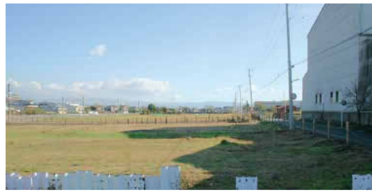
貨物列車がホームに入りコンテナを積みおろし後、発車します。地域の生活・環境に充分配慮されます。

原西部地区JR東海道本線の南側に広がる広大な土地が新貨物駅の建設用地です。新貨物駅周辺においては、環境に配慮しつつ、調整池・緑地や道路・水路の整備を行うことで、周辺住民の生活環境の向上や交通の利便性が高まります。平成20年度には、新貨物駅予定地でも埋蔵文化財調査が行われる予定です。