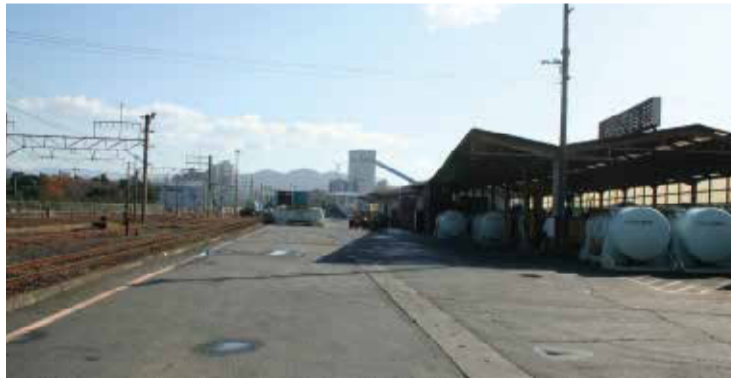
貨物駅移転跡地は沼津駅西部地区の発展を担います。

明電舎沼津事業所の南、新中川西にあるのが現在の貨物駅です。写真にある貨物引き込み線などの施設のほかに沼津駅の構内等にも貨物の線路などが多数あり、合計で約74,000㎡です。これらを原西部地区に移転いたします。移転後は、市民のニーズを取り入れた跡地利用が検討される予定です。