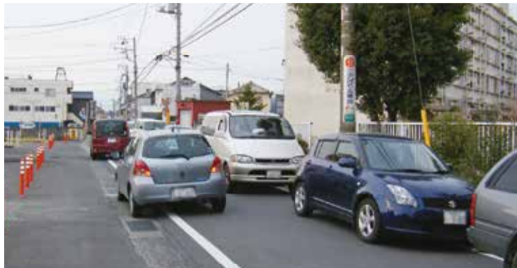
朝夕は渋滞がひどく大変不便です。早くなんとかして下さい。

富士見町付近は、JR東海道本線とJR御殿場線に囲まれた地区で、今年度、市が静岡東部拠点第二地区土地区画整理事業に着手しました。土地区画整理事業により、宅地や道路、公園などの公共施設が整備されます。現在のJR御殿場線高田踏切とJR東海道本線日吉踏切を結ぶ道路は、都市計画道路平町岡一色線として整備されます。