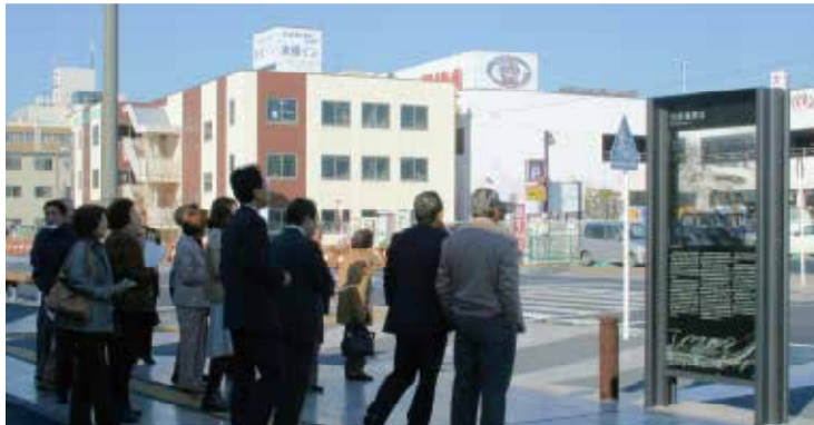
北口駅前に東西道路(七通線)の整備が進んでいます。