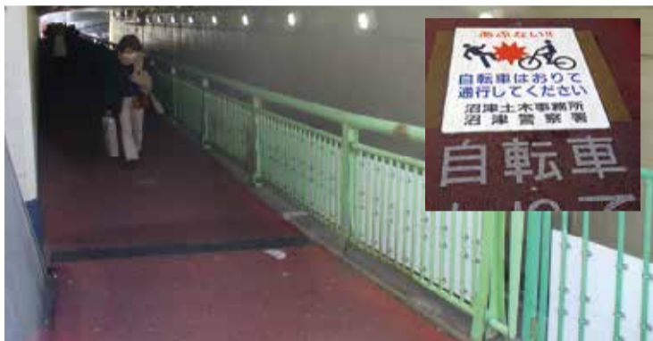
鉄道高架化完成までこのガードを使います。